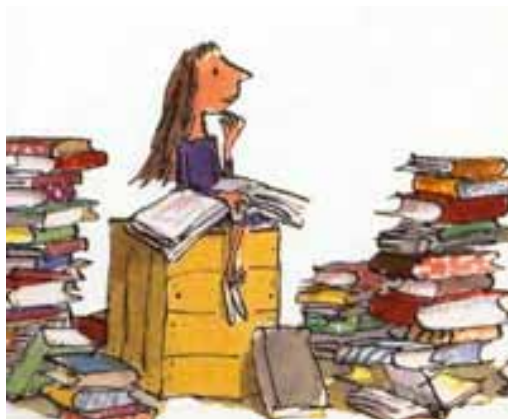
L'ORCO IL LUPO LA BAMBINA E IL BIGNÈ' Philippe Corentine, Babalibri, 2004